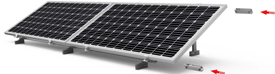
Kit 1 - Colocar las uniones (x2) suministradas el Kit de unión en el interior de los perfiles guía del Kit1