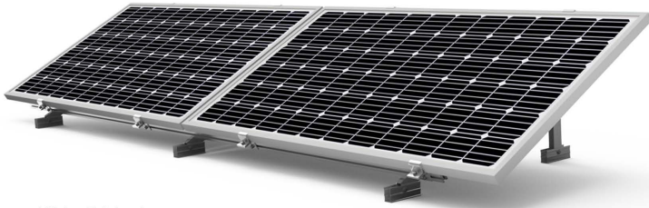
Kit 1 - Existente