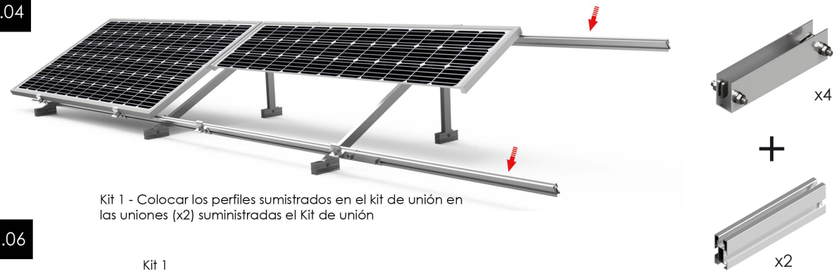
Kit 1 - Colocar los perfiles suministrados en el kit de unión en las uniones (x2) suministradas el Kit de unión