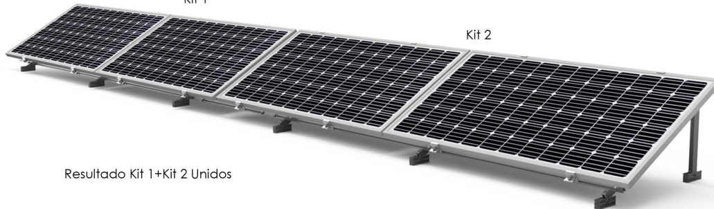
Resultado Kit 1+Kit 2 Unidos