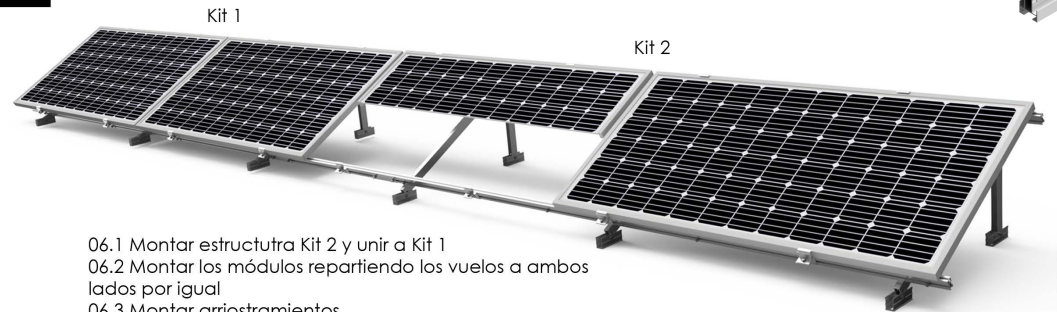
06.1 Montar estructura Kit 2 y unir a Kit 1 06.2 Montar los módulos repartiendo los vuelos a ambos lados por igual 06.3 Montar arriostramientos