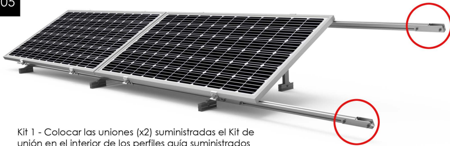
Kit 1 - Colocar las uniones (x2) suministradas el Kit de unión en el interior de los perfiles guía suministrados en el Kit de unión