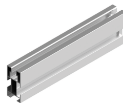
Perfil compatible: G1

Disponibilidad de tuercas antirrobo. Material 100% reciclable. Cómoda instalación.