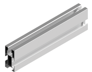
Perfil compatible: G1