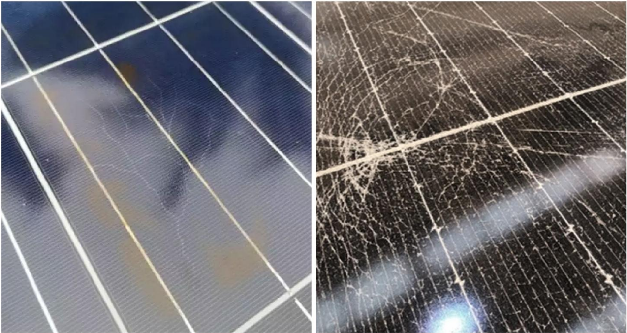
Ejemplo de estrés térmico