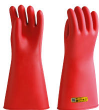
CG- Clase 1,2,3,4